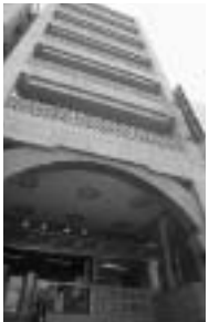
法科大学院の授業がスタートした。学生たちは真剣な表情で授業を受けている。

お茶の水キャンパスでは、4階と5階が院生室になっていて、それぞれ専用の座席と個人ロッカーが与えられ、座席からはLANケーブルでインターネットを介して、各種のデータベースにアクセスすることが可能だ。自分が必要とする法律の判例をノートパソコンから検索、院生室内のプリンタで大量にプリントアウトして資料とし、レポートの作成に余念がない。そんな光景が静穏な院生室のあちこちで見られる。院生室は午前8時から24時まで、休日もオープンされ、毎日夜遅くまで残って勉強している学生も少なくない。その真剣な学習ぶりは、まさに将来の法曹を目指す姿にふさわしいものがある。