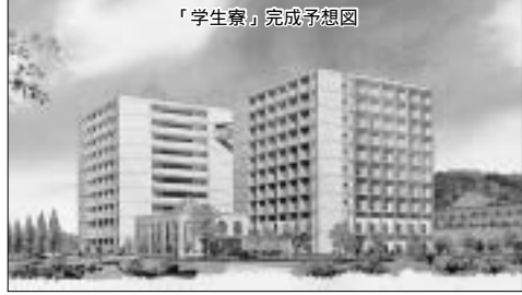
「学生寮」完成予想図

キャンパスの東側、人間市に通じる道路をはさんで隣接する土地で、創立20周年記念事業として『飯能第二キャンパス(仮称)』の造成工事が進んでいます。 およそ8・1ヘクタールの広大な土地の『飯能第二キャンパス(仮称)』には、「学生寮」のほか、「野球場」、「多目的グラウンド」が併設される予定です。現在のキャンパスとの間に挟まれる道路には、陸橋(歩道)が設けられ、両キャンパスを安全に行き来できるようにします。 「学生寮」は、地上10階建てで、322室を備える大規模の施設(完成予想図参照)であり、一般学生に加えて交換留学生等の宿舎としても活用される一方で、福利厚生の一環として教職員の宿舎としても活用、平成18年4月入居開始予定です。 また、「野球場」が整備された後には、既設の野球場をラグビー場とし、陸上トラック内のグラウ