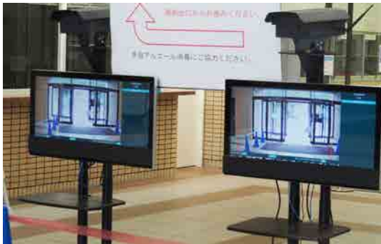
第二講義棟1階に設置してあるサーマルカメラ