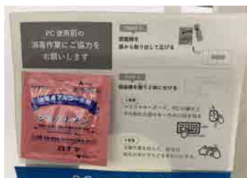
アルコール綿を設置しています