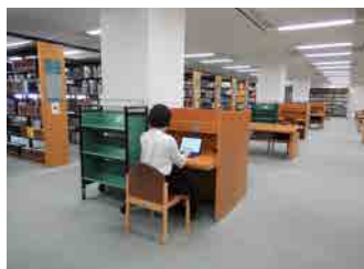
図書エリアの様子