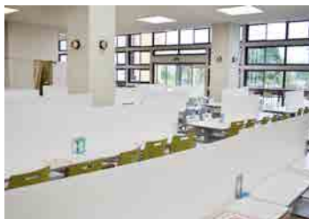
大学会館（食堂）1階の様子