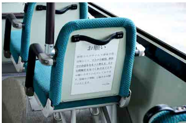
スクールバスの様子