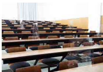
教室にパーテーションを設置