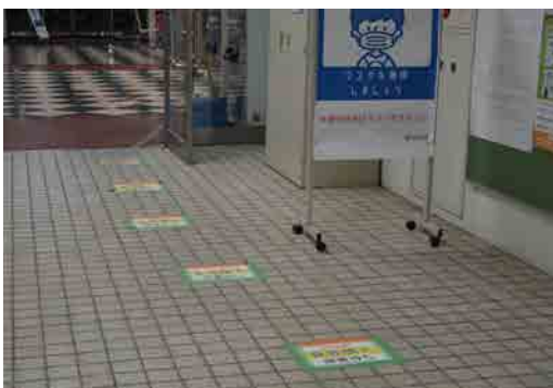
大学会館(食堂)の食券購入場所の様子