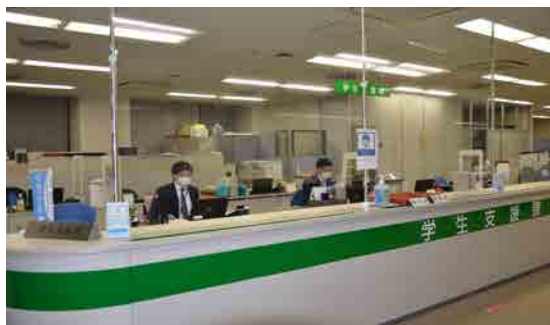
事務室の窓口カウンターの様子