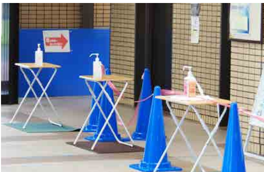
第二講義棟1階に設置している消毒液