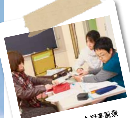
知能検査を使った授業風景

どちらの専攻も学部での学習内容(たとえばコース)にかかわらず、受験できます。駿河台大学心理学部卒業生には一定の基準を満たせば学内推薦(入学検定料免除)という道があります。