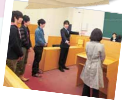
目撃証言の実験の風景

裁判では時に冤罪が生まれるように、必ずしも完全な判断がなされるわけではありません。虚偽自白や誤判あるいは目撃証言の信ぴょう性など、裁判の場で起きる問題を心理学の立場から考えます。