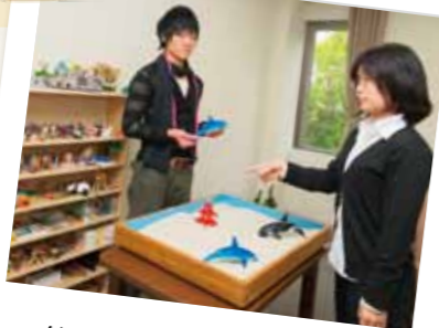
箱庭療法を使った授業風景

心理的、身体的、社会的に目覚ましく発達するこの時期の発達を支えるための心理学的視点を、不登校やストレスマネジメントなどを中心に学習します。