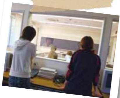
行動観察室での実験風景

専門職となるとその多くが公務員になります。国や都道府県、大都市では専門職としての公務員試験があります。地方公務員では児童相談所や障害児(者)支援施設などが主な職場となります。国家公務員では法務省関係、文部科学省関係、厚生労働省関係に専門職として活躍できる場があります。他に家庭裁判所調査官、警察の被害者相談なども専門職としての仕事となります。