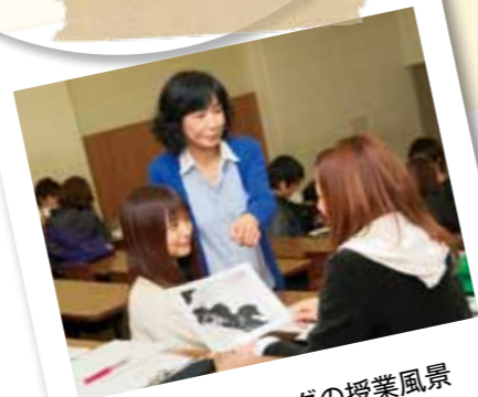
カウンセリングの授業風景

カウンセリングについて、擬似的体験を通して学習します。また、カウンセラーとクライアント(相談に来た人)との関係などについても学習します。