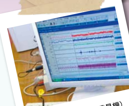
ポリグラフ (うそ発見機)

現在、我が国で大きな問題となっている犯罪・非行について、その発生メカニズムや抑止の方法について学びます。また、被害者問題についても学習します。