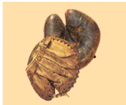
明治時代の野球グローブ