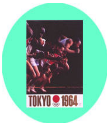
東京オリンピックポスター