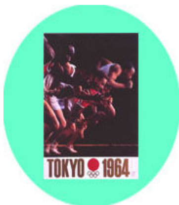
東京オリンピックポスター